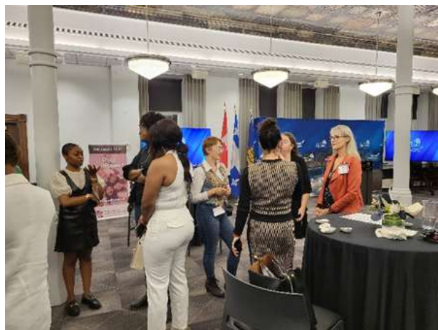
Figure 4. Réseautage à la soirée de l'hôtel de ville

démocratie municipale pour la région de la Capitale-Nationale.