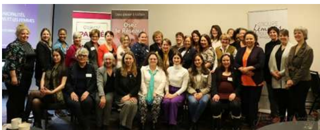
Figure 10. Les participantes au Chantier sur la Parité au municipal

Ainsi, le 2 mars 2023, en collaboration avec le Groupe Femmes Politique et Démocratie, nous avons organisé un chantier de réflexion « La parité au municipal : comment y parvenir ? ». Nous avons réuni une trentaine de femmes, élues, ex-élues et autres citoyennes intéressées par la politique municipale et par l'implication citoyenne, en provenant de la grande agglomération de Québec et des MRC de la région. Un état de la situation a été présenté, puis ensemble, à travers des ateliers d'échange et de réflexion, nous avons cherché des pistes d'action pouvant mener à la parité dans les conseils de ville.