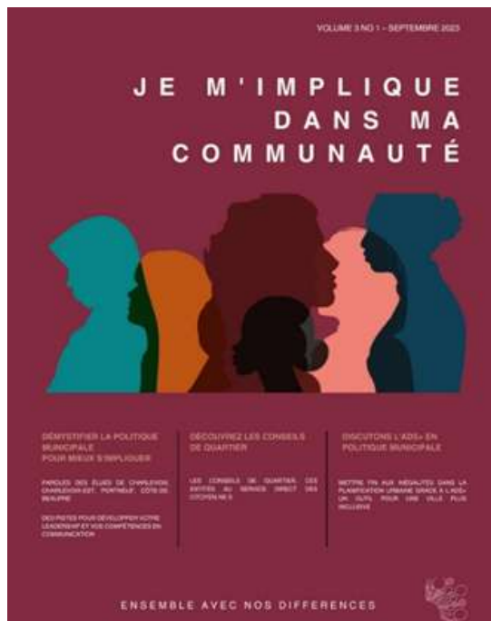
Figure 7. Couverture du magazine d'octobre 2023

Un nouveau magazine sera publié à l'hiver avec pour thématique centrale cette fois les politiques EDI (équité, diversité, inclusion).