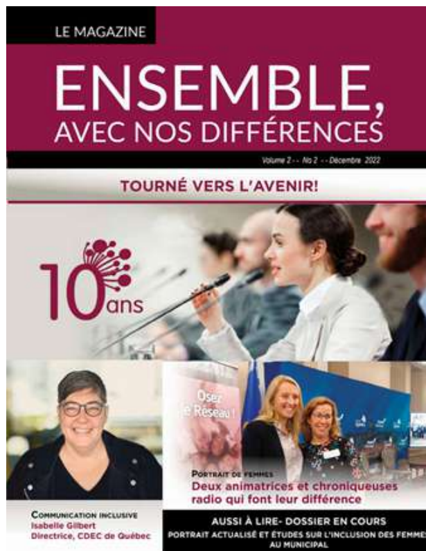
Figure 6. Couverture du magazine de décembre 2022

Finalement, ce magazine a aussi été l'occasion de présenter un portrait statistique de la Capitale-Nationale qui constituait une étape dans la réalisation de notre projet Inclusion.