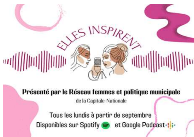
Figure 8. Logo des balados du Réseau

L'année 2023 a été aussi synonyme de nouveauté pour le Réseau puisque nous avons lancé nos tous premiers balados au mois de septembre. "Elles inspirent" a été créé pour faire découvrir des femmes inspirantes et impliquées.