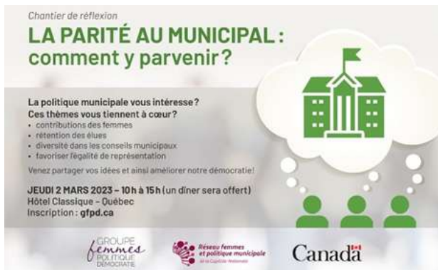
Figure 9. Image promotionnelle du chantier sur la Parité au municipal

Ainsi, le 2 mars 2023, en collaboration avec le Groupe Femmes Politique et Démocratie, nous avons organisé un chantier de réflexion « La parité au municipal : comment y parvenir ? ». Nous avons réuni une trentaine de femmes, élues, ex-élues et autres citoyennes intéressées par la politique municipale et par l'implication citoyenne, en provenant de la grande agglomération de Québec et des MRC de la région. Un état de la situation a été présenté, puis ensemble, à travers des ateliers d'échange et de réflexion, nous avons cherché des pistes d'action pouvant mener à la parité dans les conseils de ville.