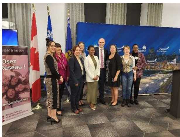
Figure 5. Personnalités politiques et représentantes du Réseau à la soirée de l'hôtel de ville

À cette occasion, les participantes à la soirée ont pu bénéficier de la gracieuse présence de Madame Catherine Vallières-Roland, vice-mairesse de la ville de Québec, de Madame Louise Cordeau, présidente depuis 2017 du Conseil du Statut de la Femme, et de l'honorable Jean-Yves Duclos, député depuis 2015 à la Chambre des communes, et ministre des Services publics et de l'Approvisionnement.