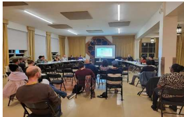
Figure 2. Conseil de quartier de Saint-Sauveur

L'idée était de leur faire vivre une expérience au sein de ces lieux de la démocratie municipale, de les familiariser avec le fonctionnement de ces instances, mais aussi de les sensibiliser à leur possible apport à leurs communautés. En plus de comprendre le fonctionnement des conseils, les procédures, et le rôle des élu.es, ces activités se voulaient aussi une porte d'entrée vers la politique municipale. Il s'agissait de les mobiliser et les guider dans leur cheminement en appuyant leur participation citoyenne.