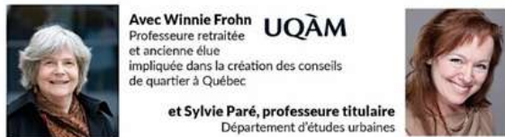
Figure 13. Image promotionnelle de la conférence sur les villes inclusives

Villes inclusives et territoires inclusifs, l'urbanisme au service des femmes