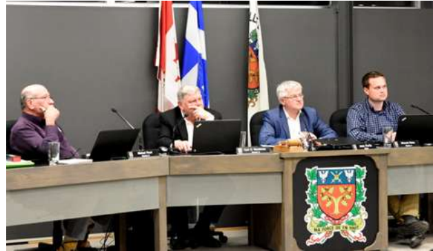
Figure 1. Conseil municipal de Baie-Saint-Paul

Nous avons invité les personnes intéressées à se joindre à l'activité prévue à l'hôtel de ville de La Malbaie, le 12 juin.